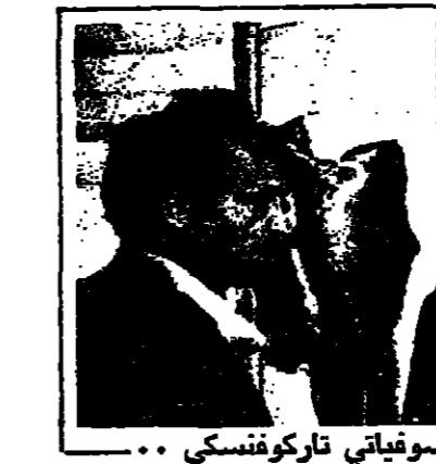
لقطة من « سولياريس » لسوفياتي تاركوفسكي ..

« رحلة الى نواة الارض » او « من الارض الى القمر » او « الجزيرة الجيولوجية » او امثال « ج. ويلز مثل « آلة الزمن » او « حرب الكواكب » او « ايلام ف. نواتشكين وسواها فقد ظلت بمسألة سيطرة الانسان على الآلة امرا يدهيها وطبيعا وغير خارق للعادة .